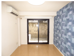
洋室はお洒落なアクセントクロスです。